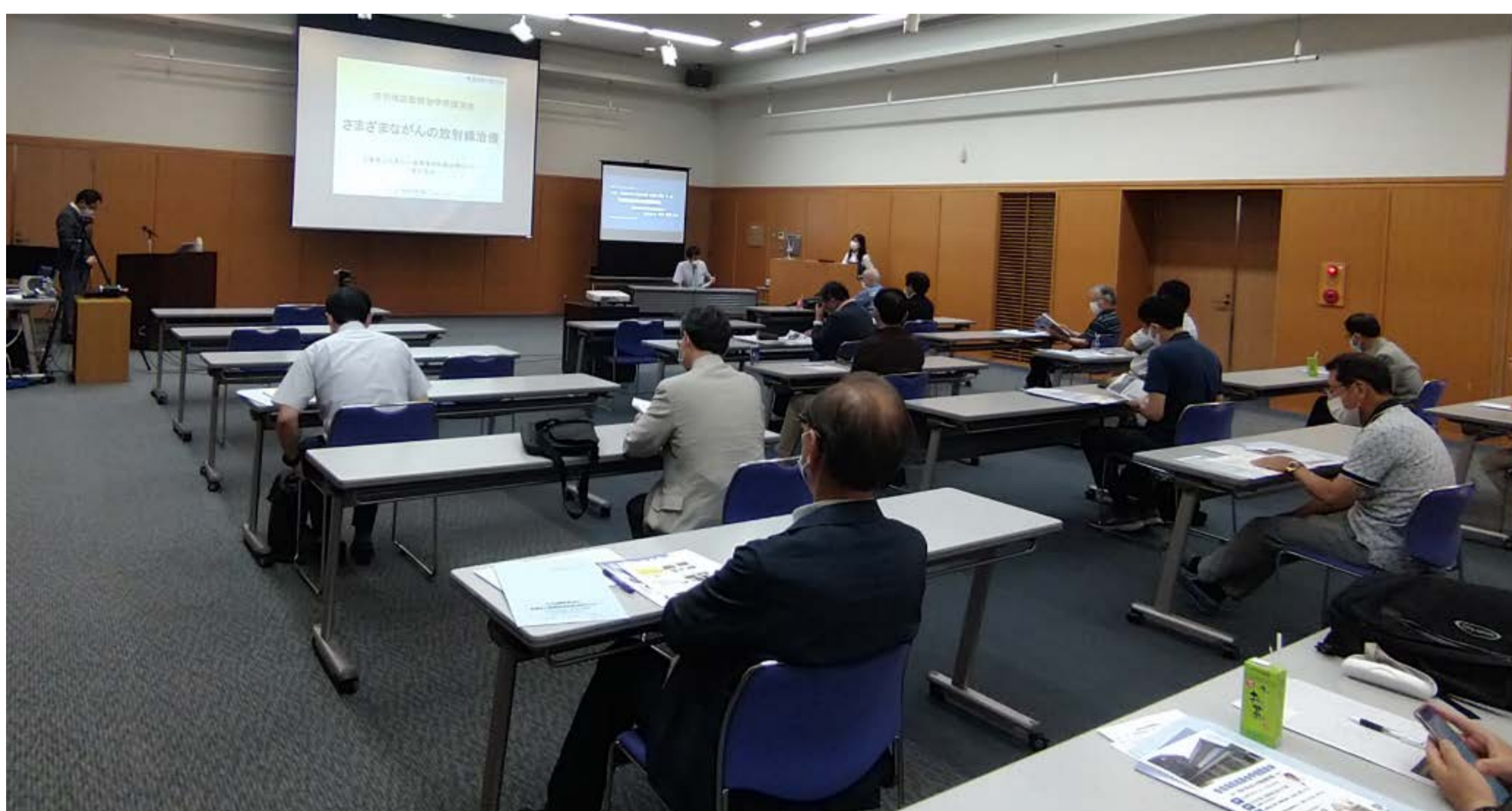
↑ ソーシャルディスタンスを保ちながら講演が実施されました。 放射線治療に関連する疑問点を質問していただきました。