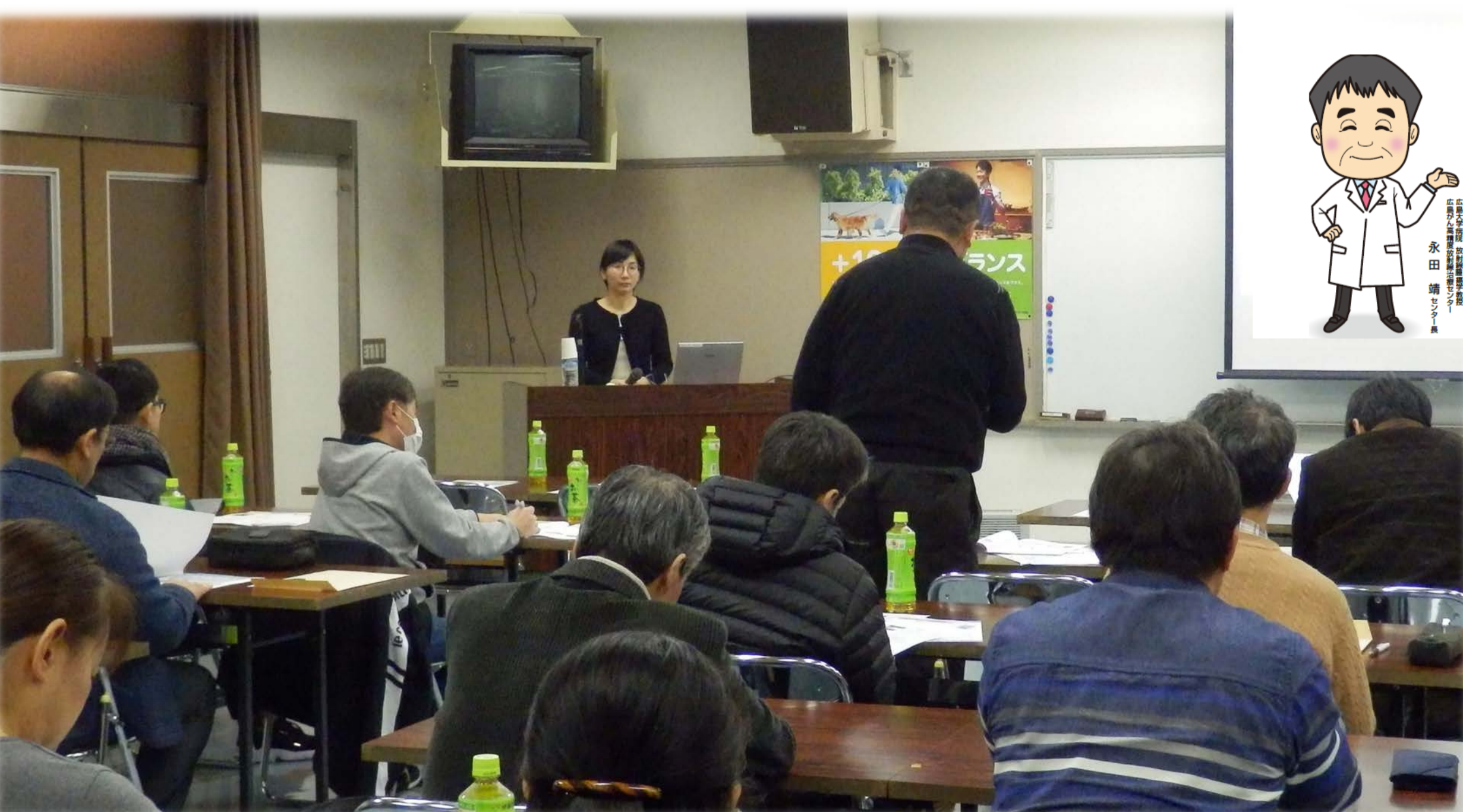
↑ 質疑応答の様子 放射線治療の疑問点を積極的に質問していただきました。