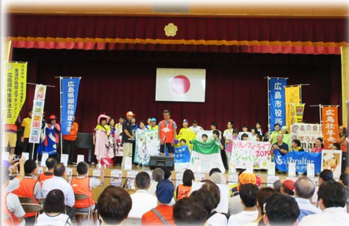
↑ 当日の会場の様子！！多くの方が参加されていました♪