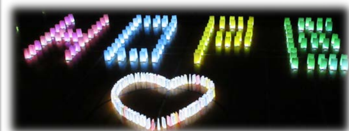
↑ 想いや願いを書いた灯籠で作られた「HOPE」☆