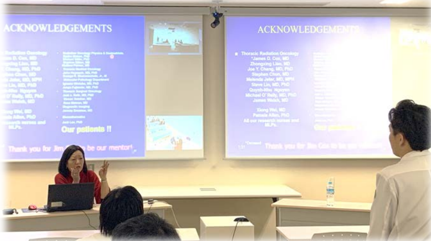
↑講演会の様子！ 最後には質疑応答も活発に行なわれました♪