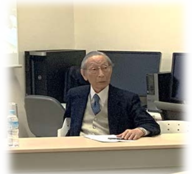
↑座長：京都大学名誉教授 阿部光幸先生